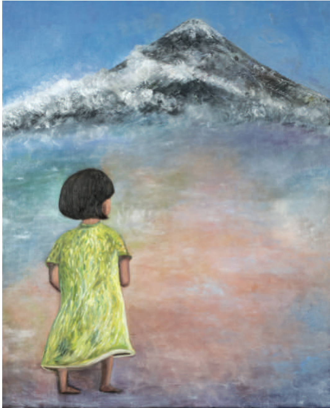
Recuerdos de Los Andes Memories of the Andes